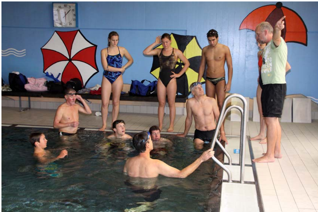
Schwimmlektion im Hallenbad