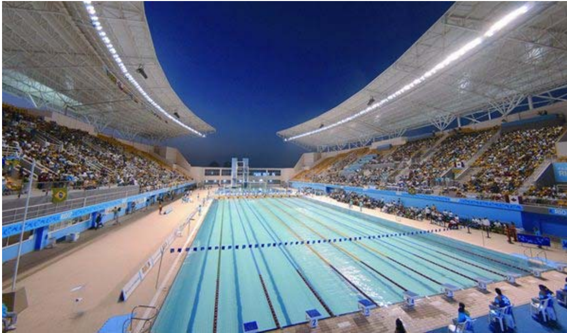
Schöne Sportanlage: Maria Lenk Aquatic Center in Rio de Janeiro