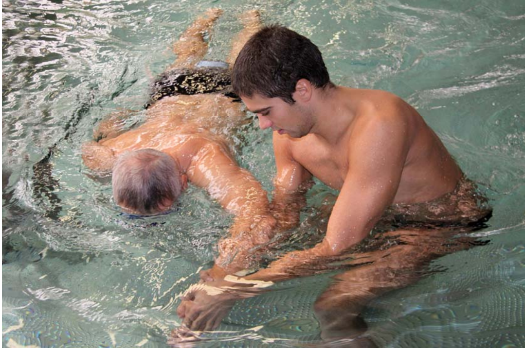
Wie funktioniert der Crawl-Armzug?